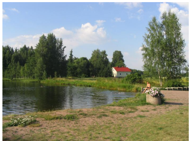
...mutta aikaa jää myös oleskeluun