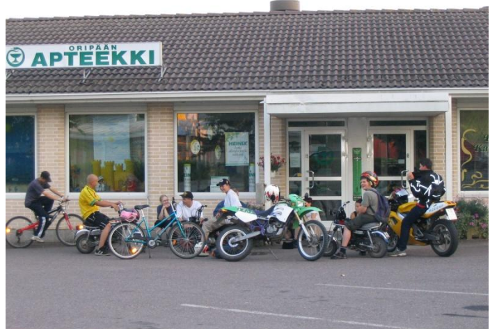
Nuoret viihtyvät Oripäessä

Naapurikunnassa on lisäksi maankuulu Alastaron moottorirata , jonne Oripään keskustasta ajaa autolla kymmenessä minuutissa. Moottoriradan läheisyys on lisännyt moottoriurheilun harrastamista myös Oripäessä. Alastarolla on mahdollisuus myös golffaamiseen.