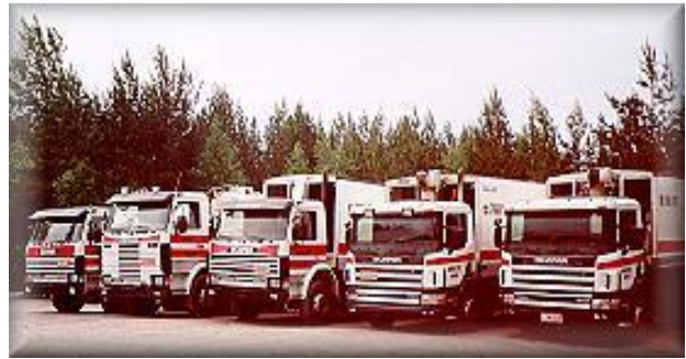
Jätehuolto Mäkiö huolehtii siisteydestä

Jätehuolto Mäkiö aloitti toimintansa Oripäässä vuonna 1966. Jätehuolto Mäkiö huolehtii jätehuollosta alueella. Jätehuolto Mäkiön toimintaan kuuluu myös kiinteistöjen jäteastioiden myynti. Mallistoon kuuluu erilaisia jäteastioita niin omakoti-, rivitalo- kuin kerrostalokiinteistöillekin.