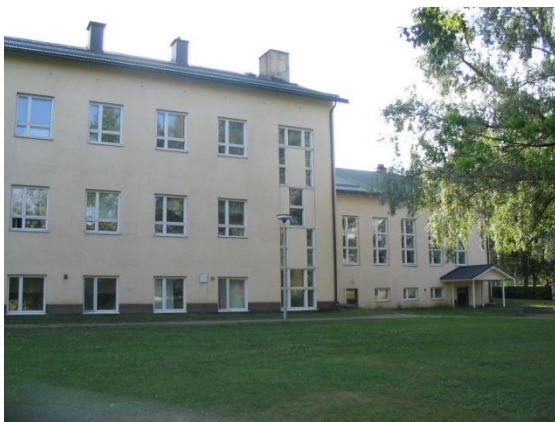
Alakoulun peruskorjaus valmistui 2004. Päiväkoti Kultasiipi on vuodelta 2008.

Oripäässä on päiväkoti, esikoulu ja useita perhepäivähoitajia. Päiväkoti Kultasiipi ja Esikoulu Nallenkolo, jossa annetaan myös esikoululaisille päivähoitoa toimivat samassa korttelissa koulun, kirjaston ja kunnanviraston kanssa. Liikuntahalli ja kuntosali valmistuivat samaan kortteliin 2012.