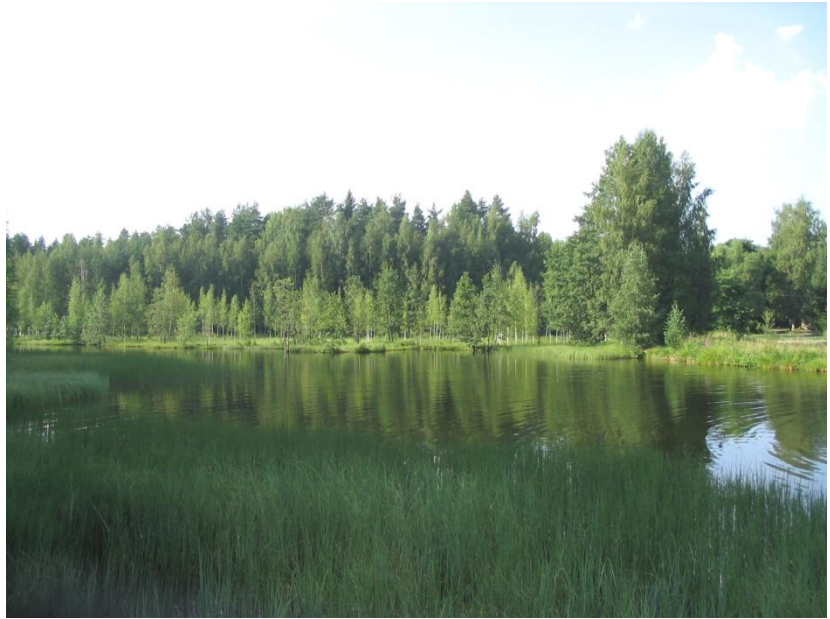
Lähteen eliöstö on ainutlaatuinen

Lähteen reunoilla viihtyvät monet kasviharvinaisuudet, kuten lähdesara, hetesara, lettosara, lehtopalsami ja nevaimarre. Lähteen linnustoon kuuluvat mm. keltävästäräkki ja koskikara.