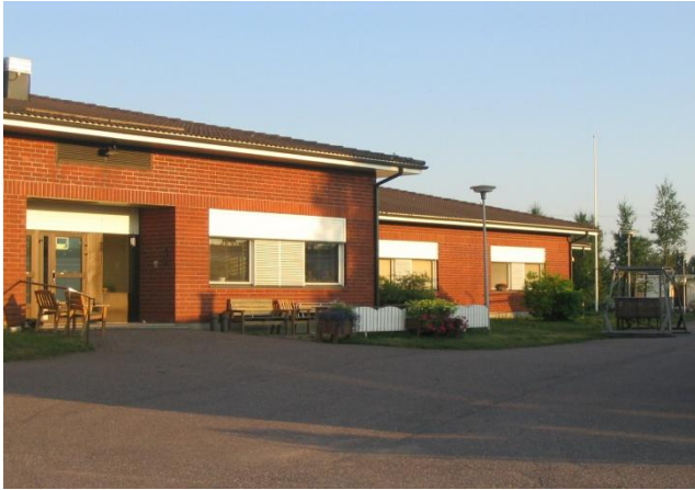
Palvelutalo kesäillan auringossa

Vanhusten palvelukeskuksen yhteydessä on palveluasumispaikkojen lisäksi rivitaloasuntoja, joissa saa asua itsenäisesti palvelujen läheisyydessä. Oripään palvelutalossa pyritään lämminhenkiseen ja kodikkaaseen ilmapiiriin. Palvelukeskuksessa järjestetään myös ikäihmisille päiväkeskustoimintaa. Palvelutalon laajennus ja peruskorjaus valmistuvat loppuvuodesta 2014.