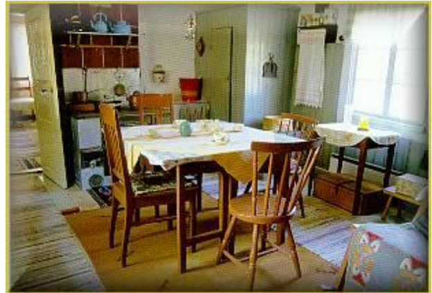
Hartmannin mökki on Varsinais-Suomen ainoa henkilöhistoriasta kertova museo