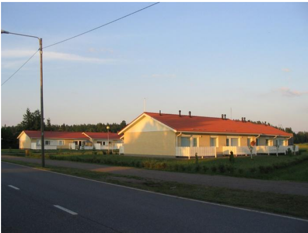
Reinosen tonttialueelle on rakennettu mm. viihtyisiä rivitaloasuntoja