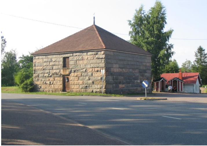
Oripään kivimakasiinissa toimii nykyisin kotiseutumuseo