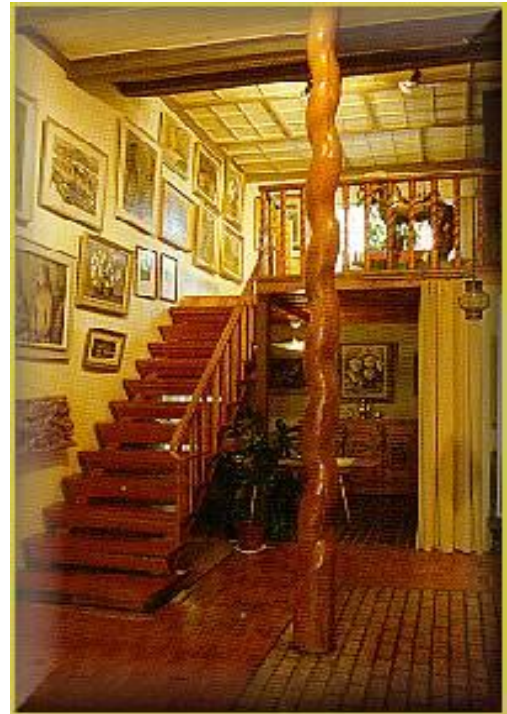
Koti kuin taideteos

Oripään kunta sai talon lahjoituksena vuonna 2008 ja vuonna 2010 se avattiin yleisölle. Villa Villeen voi tutustua kesäsunnuntaisin tai kirjastosta voi varata opastuksen ryhmälle ympäri vuoden.