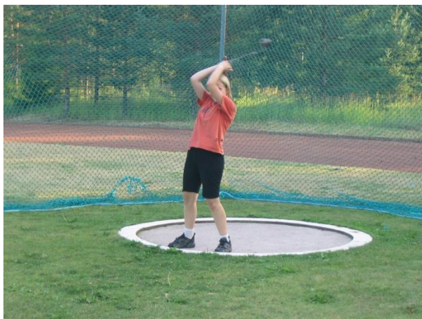
Oripäässä riittää aktiviteetteja...

Oripään lentokentällä voi harrastaa ilmailua, ja Turun lentokerho tarjoaa kentällä mm. lennonopetusta. Turun moottoriurheilijoiden endurorata sijaitsee lentokentän läheisyydessä.