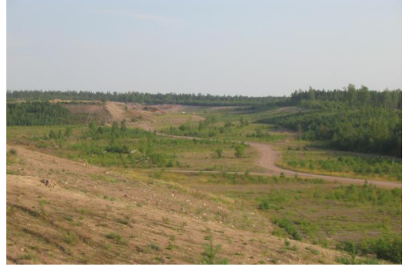
Maisemointi on tärkeää soranoton jälkeen

Oripää on tunnettu paitsi pohjavedestään, myös harjualueensa sorasta. Useilla suurilla sorayhtiöillä on kunnassa soranottopisteensä. Läänin Kuljetus Oy:n, Lohja Rudus Oy:n ja Nurmen Sora Oy:n kuorma-autot ovat tuttu näky Oripään alueella.