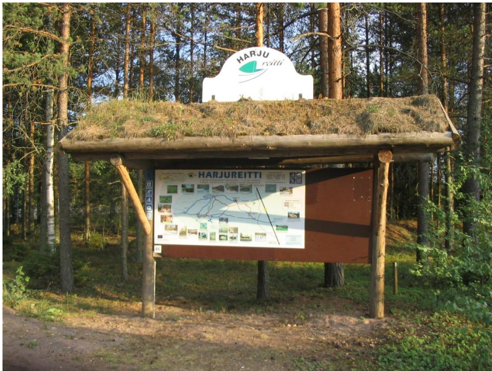
Komeat opasteet tiedottavat harjureitistä