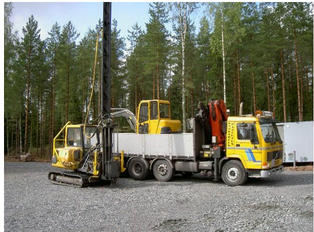
Tuentatyö on tehtävä kunnan välineillä

Kankareen paalutus sai Okrassa 2014 seutukunnan yrittäjäpalkinnon.