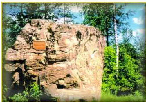
Teinien kivellä levähtivät aikoinaan ilkikuriset opiskelijat

Oripäästä muutama kilometri Loimaan suuntaan nykyisen pienlentokentän tuntumassa on kivistä muurattu vapaussodan muistomerkki, joka on pystytetty vuonna 1932 valkoisten veteraanien muistoksi.