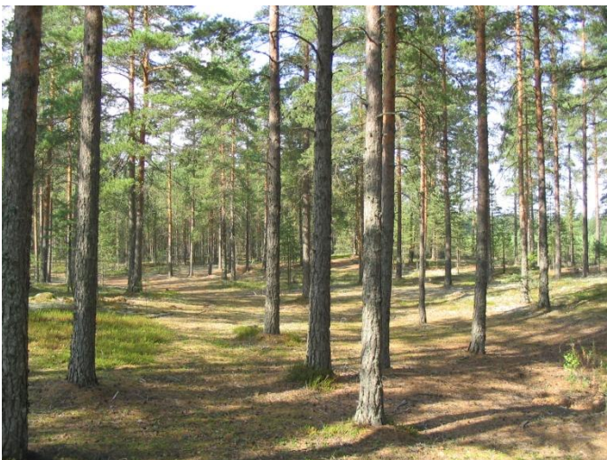
Oripäänkankaalla on kaunista metsäluontoa