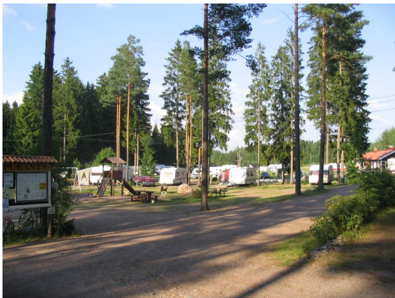
Krapuranta on idyllinen ja rauhallinen leirintäalue

Oripään Krapuranta SF-Caravan –alue. Leirintäalueen ympäristö on kaunista ja palvelutarjonta on monipuolinen. Krapurannassa on kaksi saunaa, uimalampi ja allas lapsille, kiosk, tarvikemyymälä, savustuspöytä sekä grillikatos. Kulkurintuvassa on viihtyisä sisäoleskelutila, keittiö ja kaikki nykyajan mukavuudet pyykinpesutiloineen ja suihkuineen.