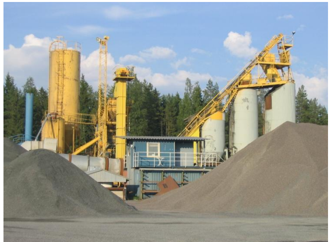
Oripäässä osataan myös teiden päällysty

Super Asfaltti Oy on suomalainen asfalttiliike, joka on perustettu vuonna 1974 ja on toiminut nykyisessä yhtiömuodossaan vuodesta 1991 lähtien. Super Asfaltti Oy:n pääkonttori ja kotipaikka sijaitsee Oripäässä. Super Asfaltti Oy:n päätoimiala on asfalttipäällysteet, mutta myös maanrakennustyöt sekä kiviaineksen myynti ja toimitukset kuuluvat yrityksen toimintaan.