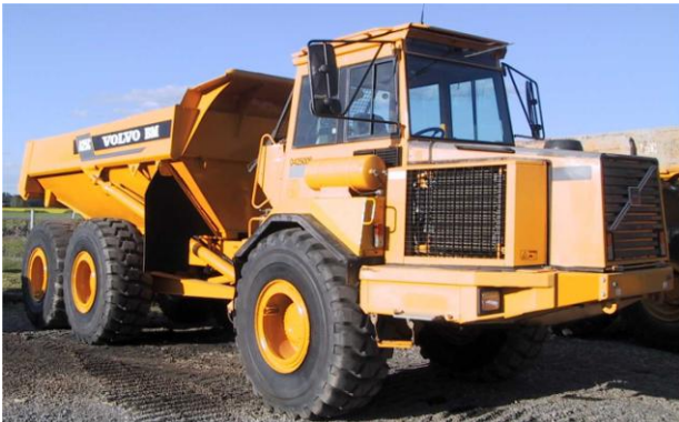
Oripäässä hallitaan konekauppa ja nostot

Supernostot Oy jatkaa tunnetun rakennusliikkeen jo 70- luvulla Oripäässä aloittamaa nostureiden vuokraus- ja urakointitoimintaa. Supernostot Oy on hankkinut kokemusta vaativista projektitöistä kotimaassa ja ulkomailla. Supernostot Oy myös toimittaa ja välittää nostoalan koneita. Konekaupasta on yrityksen henkilökunnalla lähes 30v kokemus ja hyvät kansainväliset yhteydet. Maan Kone Oy tekee maanrakennuskonekauppaa kotimaassa ja kansainvälisesti. Yhtiö on perustettu vuonna 1997. Yritys ostaa alan koneita ja toimittaa niitä asiakkailleen myös ulkomaille.