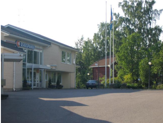
Oripäässä on hyvät päivittäispalvelut

Oripää on reilun 1 400 asukkaan kunta, jossa maaseudun rauha sekä luonnonläheisyys antavat miellyttävän asuin- ja elinympäristön asukkailleen. Oripää tarjoaa hyvät kauppa-, pankki-, ja muut peruspalvelut sekä monipuoliset mahdollisuudet kulttuuri- ja vapaa-ajan harrastuksiin.