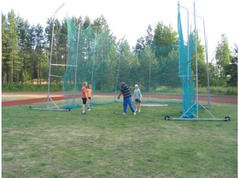
Oripäässä voi moukarinheitossa saada oppia vanhoilta mestareilta

Oripään urheilukentällä on kesäisin vilkasta. Urheilukentällä on ajanmukaiset, lajikohtaiset harjoittelupisteet. Juoksurata on tiilimurskapintainen, mutta hyppy- ja heittopaikat on päällystetty tartaanilla. Oripäässä on vuosien aikana ollut mm. monia lahjakkaita keihään- ja moukarinheittäjiä sekä pituus- ja korkeushyppääjiä kävelijöitä, ampujia sekä lentopalloilijoita.