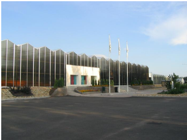
Kauppapuutarha Ylitalo Oy:n näyttävät toimitilat.

Kauppapuutarha Ylitalo Oy tuottaa laajat valikoimat erilaisia ruukkukasveja. Yrityksen tuotteisiin kuuluvat mm. saintpauliat, krysanteemit, marketat, atsaleat, tulilatvat ja viherkasvit. Puutarha hyödyntää tuotannossaan tehokkaasti tekniikkaa. Konepaja ja Puutarha O. Isotalo Oy ja Oksasen puutarha Oy viljelevät kasviksia. Tuotanto pyörii kasvihuoneissa ympäri vuoden. Martin Tarhassa toimii puutarhatuotannon lisäksi oma myymälä, josta voi paitsi ostaa ruukkukukkia istutettavaksi, myös tilata kukkalaitteet juhla- ja muistotilaisuuksiin.