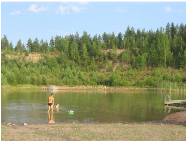
Vapaa-ajan keskuksessa on hauska polskutella

Kirjasto on lukutoukan pysähdyspaikka, joka on myös kulttuuri- ja sivistystoiminnan ideointikeskus. Oripääläiset ovat viime vuosien aikana innostuneet yhä enemmän näyttelemisestä. Kunnassa on sekä lahjakkaita harrastajanäyttelijöitä, että taitavia käsikirjoittajia. Kuntalaisten näytelmiä saadaan seurata monissa yleisötahtumissa, kuten Kotiseutupäivillä. Kirjastoa laajennettiin 2012 ja kävijämäärä onkin ollut kasvussa.