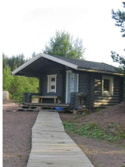
Uimalammen rannalla on hirsinen sauna