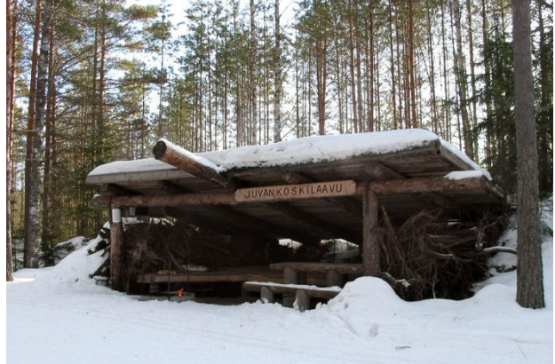
Juvankoskilaavu sijaitsee Juvankoskella, joka on Oripään kunnan erillinen enklaavialue

Harjualue on kaunista luontomaisemaa, josta paikoitellen aukeaa komeat näkymät yli laakean maiseman. Hiihto- ja retkeilyreitistön lisäksi reitistöön kuuluu pyöräilyreitistö, joka kulkee pitkin historiallista Huovintietä.