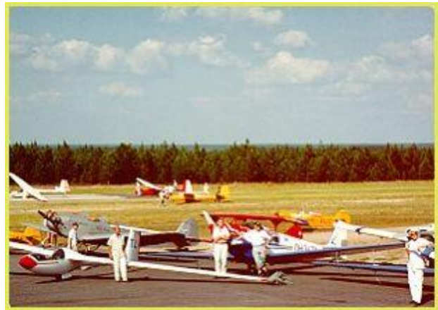
Oripään lentokentältä nousee kesäisin ilmaan koneita tiheään tahtiin

Oripäänkankaan harjualueella sijaitsee Turun lentokerhon isännöimä, puolustusministeriön omistuksessa oleva pienlentokenttä. Kentällä on kaksi kiitotietä. Pääkiitotien pituus on 1350 m ja leveys 14 m. Risteävän kiitotien pituus on 950 m. Molemmat kiitotiet ovat kestopäällystettyjä. Kentällä on neljä lentokonehallia , lentokonepolttoaineen tankkauspiste , säähavaintoasema ja kerhorakennus . Rakennuksesta löytyvät myös koulutus-, oleskelu-, sauna- ja pesutilat. OKRA-areena, 1500 m 2 halli, muuntuu isoksi ravintolaksi ja lisäksi vuonna 2014 on valmistunut monikäyttötila, 400 m 2 .