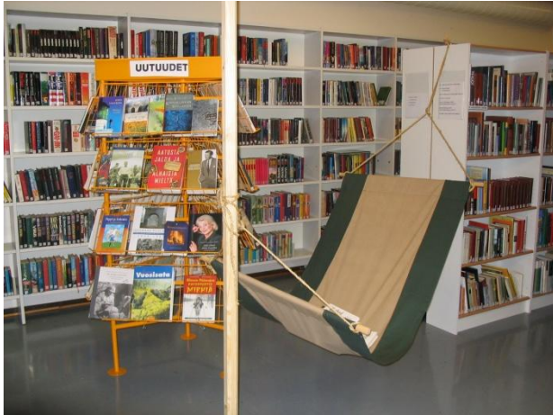
Kirjastossa somisteet vaihtuvat vuodenaikojen mukaan

Kirjasto on lukutoukan pysähdyspaikka, joka on myös kulttuuri- ja sivistystoiminnan ideointikeskus. Oripääläiset ovat viime vuosien aikana innostuneet yhä enemmän näyttelemisestä. Kunnassa on sekä lahjakkaita harrastajanäyttelijöitä, että taitavia käsikirjoittajia. Kuntalaisten näytelmiä saadaan seurata monissa yleisötahtumissa, kuten Kotiseutupäivillä. Kirjastoa laajennettiin 2012 ja kävijämäärä onkin ollut kasvussa.