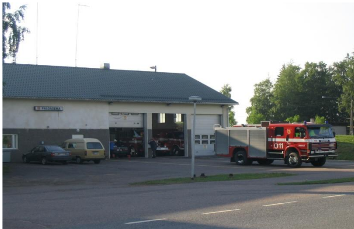
VPK-toiminta on vastuullinen harrastus

Seuratoiminta on Oripäässä aktiivista. Kunnassa on mm. kaksi urheiluseuraa, Oripään Urheilijat ja Oripään Vesa.