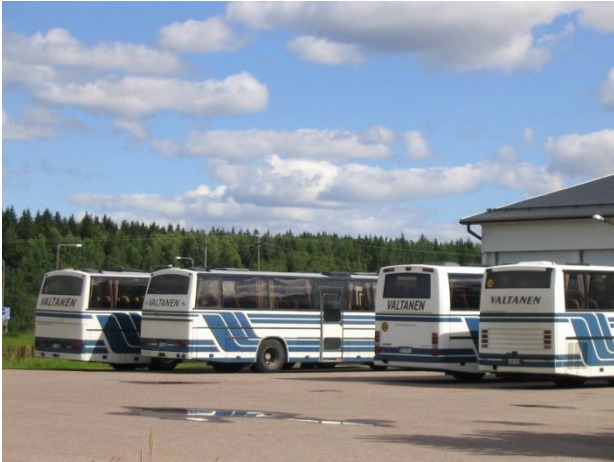
Linja-autoja Oripäässä riittää