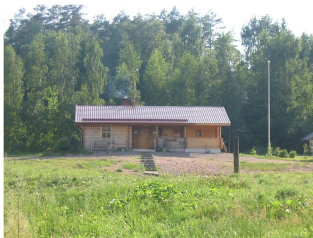
Myllykyläläisten käsissä syntyy vaikka mökkejä

Oripään enklaavissa, Juvankoskella, Juvankoski nousee ry tekee töitä Harjureitin kehittämiseksi.