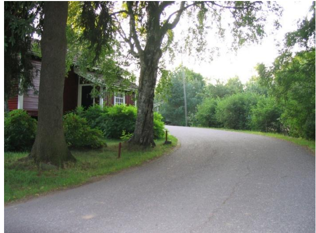
Kanikkalankujan asukkaat saavat nauttia viehättävästä raittimiljööstä

Rehevien puiden reunustama Kanikkalankuja alkaa Oripään keskustasta ja päättyy Vähä-Kössin tilalle, jossa muuttuu Salamäentiekseksi. Kapean ja mutkaisen Kanikkalankujan nimen arvellaan viittaavan entisajan asujaimistoon. Elo käsityöläisten omistamissa pienissä mökeissä oli niin soukkaa, että kannikatkit syötiin