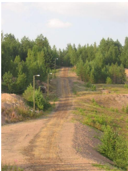
Vapaa-ajan keskuksessa kiertää pururata.

Kirkonkylän koulun lähistöllä on talvisin jääkiekkokaukalo ja kesäisin tenniskenttä.