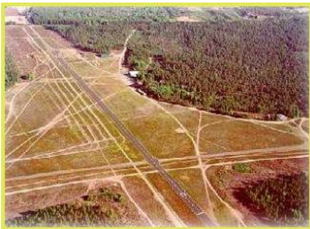
Oripäässä on hyvät mahdollisuudet harrastaa ilmailua

Kentällä suoritetaan myös lentokoulutusta. Lentolupakirjan suorittamisesta saa lisätietoa Turun lentokerholta . Oripään lentokenttä toimii kahden vuoden välein myös kesäisen OKRA-maatalousnäyttelyn pitopaikkana. Näyttelyn pääjärjestäjänä toimii Lions Club Oripää.