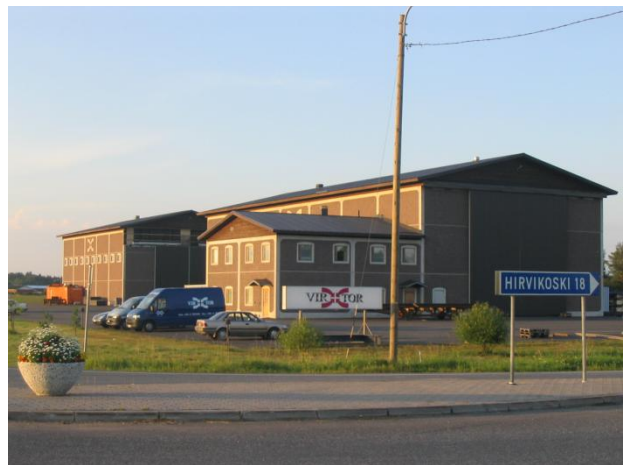
Virtor Oy:llä on tyylikkääät tuotantotilat

Virtor Oy on toiminut asennuskonepajana vuodesta 1994 lähtien. Yrityksen toimialaa ovat sillojen, säiliöiden ja teräsrakenteiden projektihallinta, suunnittelu, valmistus ja asennus. Yrityksellä on myös kansainvälisiä markkinoita. Yritys on mm. valmistanut polttoainesiloja Ruotsiin ja hiekkasiiloja Australiaan sekä tehnyt laiteasennuksia Hollantiin.